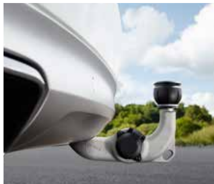
PUSAUTOMĀTISKS ELEKTRISKAIS PIEKABES ĀKIS 1080 € Pieejams pilnībā jaunajiem Volvo XC90, S90 un V90.