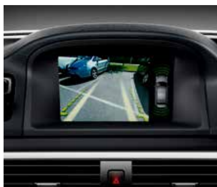
STĀVVIETĀ NOVIETOŠANAS PALĪDZĪBAS KAMERA 930 €