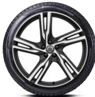
ZIEMAS RITEŅU KOMPLEKTS 5 DUBULTIE SPIEKI MATĒTI MELNĀ KRĀSĀ 21" 4181 € VOLVO V90/S90.