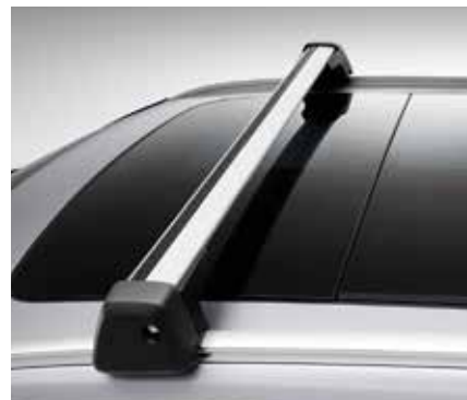
JUMTA ŠĶĒRSSTIENI 208 €