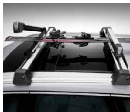
SLĒPĶU TURĒTĀJS, ALUMĪNIJA 175 €

! IEVĒROJIET, KA VISI ŠIE PIEDERUMI NAV PIEEJAMI VISIEM VOLVO MODEĻIEM. JAUTĀJIET VIETĒJAM DĪLERIM VAI SKATĪTIES VOLVOCARS.COM, LAI UZZINĀTU, VAI ATTIECĪGAIS PIEDERUMS IR PIEEJAMS JŪSU VOLVO.