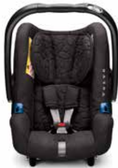
MAZUĻI SĒDEKLĪTIS 174 €

volvocars.com / collection.volvocars.com