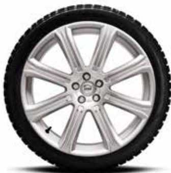
ZIEMAS RITEŅU KOMPLEKTS, 8 SPIEKI SUDRABA KRĀSĀ 21" 4313 € PILNĪBĀ JAUNAIS VOLVO XC90 T8, PILNĪBĀ JAUNAIS XC90 TWIN ENGINE T8.

Vairāk informācijas volvocars.musamotors.lv