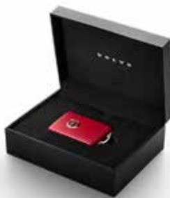
SARKANA DROŠĪBAS ATSLĒGA 138 € Lai uzzinātu vairāk, jautājiet vietējam dīlerim.