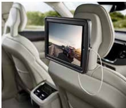
IPAD TURĒTĀJS 753 € Pieejams pilnībā jaunajam Volvo XC90.