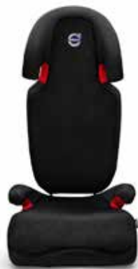
BĒRNU SĒDEKLĪTIS - PALIKTNIS AR PAMATU UN ATZVELTNI 197 €