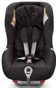
UZ AIZMUGURI VĒRSTS BĒRNU SĒDEKLĪTIS 492 €