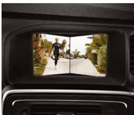
PRIEKŠĒJĀ "AKLĀ PUNKTA" SKATA KAMERA 715 €