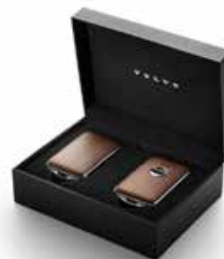
ATSLĒGU KORPUSI 204 €