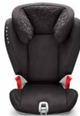
BĒRNU SĒDEKLĪTIS - PALIKTNIS 339 €