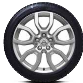
ZIEMAS RITEŅU KOMPLEKTS 17" 2349 € VOLVO V40 CROSS COUNTRY.