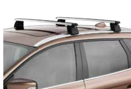
JUMTA ŠĶĒRSSTIENĪ 267 €

! LŪDZU, ŅEMĪET VĒRĀ, KA VISI PIEDERUMI NAV PIEEJAMI VISIEM VOLVO MODELIEM. SAZINIETIES AR VIETĒJO VOLVO PĀRSTĀVI VAI APMEKLĒJIET VIETNI VOLVOCARS.COM , LAI UZZINĀTU, VAI KONKRĒTAIS PIEDERUMS JŪSU VOLVO IR PIEEJAMS.