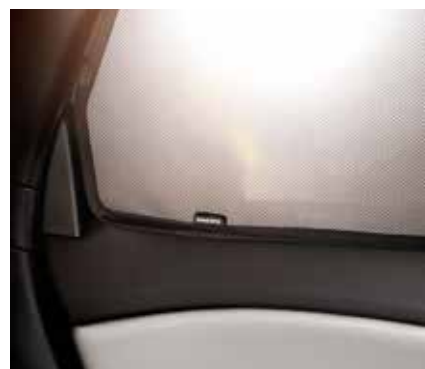
SAULSARGS AIZM. DURVĪM 173 €