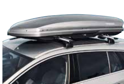
JUMTA KASTE SPACE DESIGN 420 937 € Pieejama Titan Silver vai melnā krāsā.