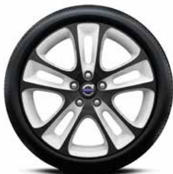
GATAVS RITENŪ KOMPLEKTS, VASARAS "ATREUS" 7,5x18" 2794 € VOLVO V40.

Pilnīgu mūsu riteņu un disku klāstu varat izskatīt vietnē volvocars.com . Kad būsiet savā Mans Volvo tīmekļa vietnē, jūs atradīsiet arī personalizētus riteņu un disku piedāvājumus, kas nevainojami der jūsu automobilim.