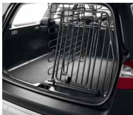
SUŅA VĀRTI 358 € Pieejami jaunajam Volvo XC90.