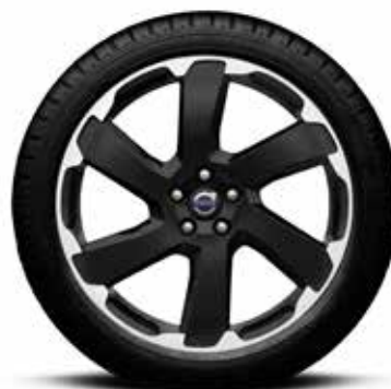
GATAVS RITENŪ KOMPLEKTS, VASARAS "TALITHA" 8x20" 3536 € VOLVO XC60.