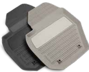
GUMIJAS PAKLĀJIŅI 107 €