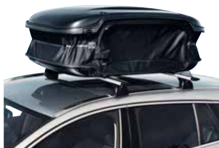
IZVĒRŠAMA JUMTA KASTE 991 €