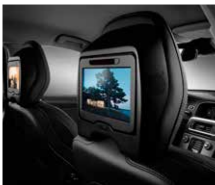
IZKLAIDES SISTĒMA AIZMUGURĒ SĒDOŠAJIEM PASAŽIERIEM 2350 € Ar diviem 8" ekrāniem.