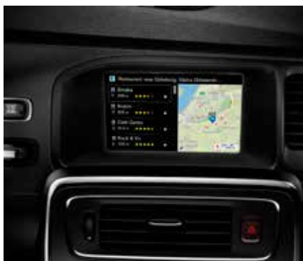
SENSUS NAVIGĀCIJA 1395 € Lūdzu, apmeklējiet Volvo pārstāvi, lai saņemtu plašāku informāciju par jūsu konkrēto Volvo modeli.