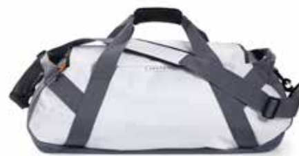
ACTIVE AUDEKLA SOMA 99 €