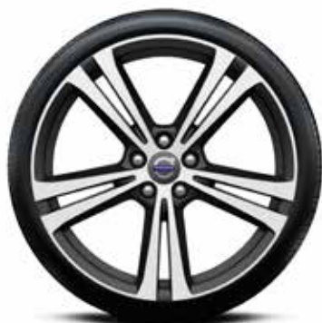
GATAVS RITENŪ KOMPLEKTS, VASARAS "ARTIO" 8x19" 3098 € VOLVO S60, V60, S80, V70.