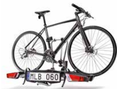
SALOKĀMS VELOSIPĒDA TURĒTĀJS, MONTĒJAMS UZ PIEKABES ĀKA 731 €