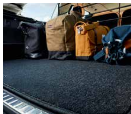
KRAVAS NODALĪJUMA AUDEKLA PAKLĀJS, APVĒRŠAMS 197 €