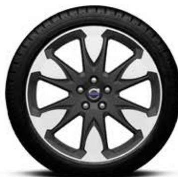
GATAVS RITENŪ KOMPLEKTS, VASARAS "ERAKIR" 8x19" 3098 € VOLVO XC70, XC60.